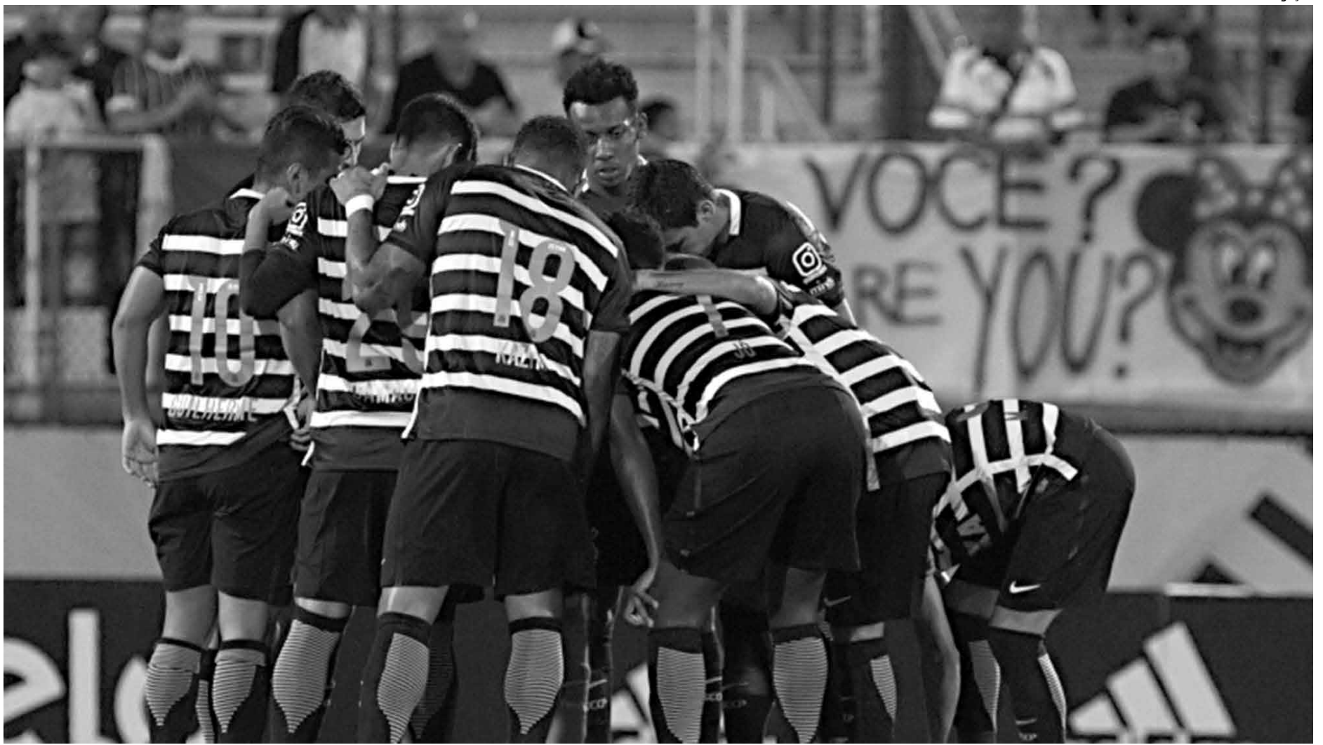
O Corinthians é um dos seis times que representarão o Brasil na Copa Sul-Americana, cujo último campeão foi a Chapecoense, que não chegou a decidir título devido à tragédia

No sorteio, que começou com homenagem à Chapecoense, atual campeã, os clubes foram divididos em dois potes: Norte (brasileiros,