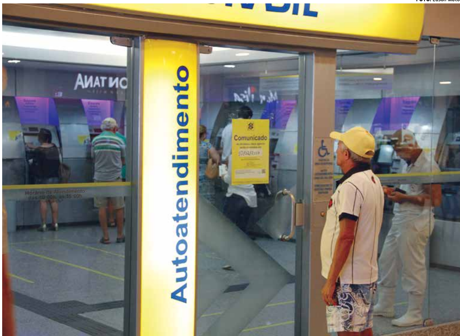
Agência do Mag Shopping, em Manairá, já afixou aviso comunicando aos clientes que as atividades serão encerradas próximo dia 10

Por outro lado, as que vão ser transformadas em posto de atendimento são as agências da Rua Treze de Maio