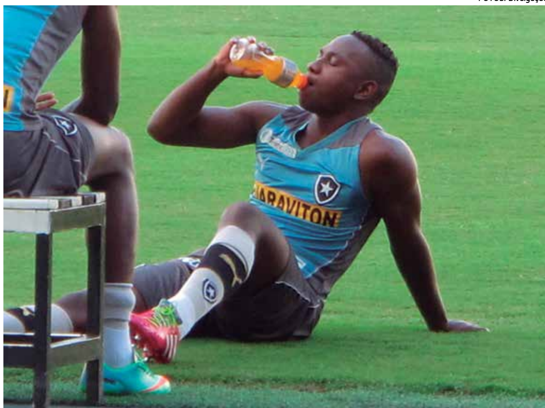
Artilheiro do time, jogador de 23 anos não tem respeitado as normas e diretrizes do clube

Neste início de temporada, ele foi reserva no duelo contra o Madureira, na semana passada, entrando no segundo tempo. No sábado, começou jogando contra o Nova Iguaçu, não rendeu, e acabou substituído.