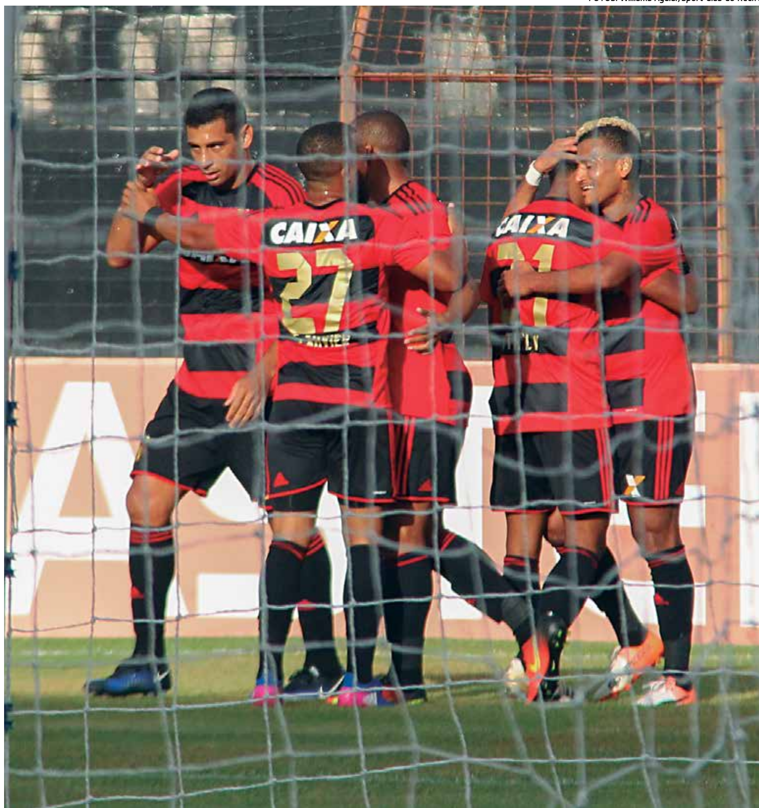
A diretoria da equipe rubro-negra acredita que o fato dos jogadores serem do Nordeste contribui para melhor adaptação aos jogos

"Já convivi com jogadores de praticamente todos os lugares do Brasil e isso, pra mim, não importa tanto. Mas claro que muitas vezes você acaba fazendo mais amizade com os jogadores que são daqui do Recife ou do Nordeste porque somos mais parecidos, temos os mesmos