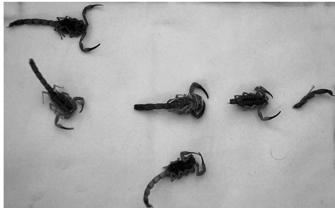
Cuidados com acidentes envolvendo escorpiões devem ser redobrados durante o período de chuvas

A árida pedreira e a floresta que ainda pulsa. Um pai muito doente revê a filha. Ressentimentos são postos à mesa. A memória dos mortos, despertada por objetos, sombras e sonhos, afeta Clarisse nesse cenário de beleza e agonia. Seu marido e os negócios a esperam na cidade.