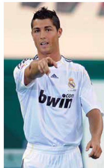
CR7 criticou os torcedores

Após a eliminação para o Celta na Copa do Rei, o Real Madrid derrotou a Real Sociedad por 3 a 0 no Santiago Bernabéu e fez as pazes com a torcida. Durante o primeiro tempo, no entanto, alguns torcedores vaiaram a equipe e Cristiano Ronaldo, revoltado com as críticas, retribuiu com xingamentos. O português acabou sendo um dos destaques do jogo com uma assistência e um gol. Com os troços de Barcelona e Sevilla, os merengues abriram 4 pontos de vantagem para os rivais na disputa pelo Campeonato Espanhol.