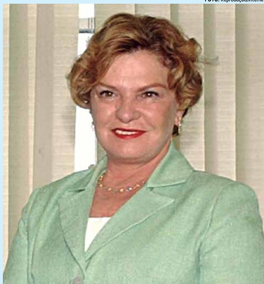
Marisa Letícia está internada no Hospital Sírio-Libanês desde o dia 24 de janeiro

A ex-primeira-dama está internada no Hospital Sírio-Libanês, em São Paulo, desde o dia 24 de janeiro, quando sofreu o acidente vascular cerebral (AVC). Na segunda-feira (30), um exame detectou a ocorrência "de trombose venosa profunda dos membros inferiores", caracterizada por um quadro de edemas e dor nas pernas, coxas e região pélvica. Médicos afirmaram que essa é uma intercorrência inerente ao tratamento.