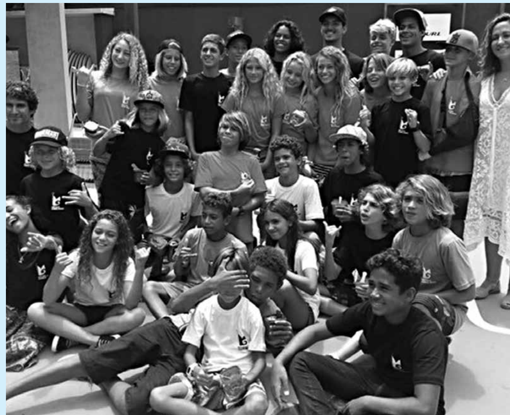
O instituto é destinado a novos talentos, na faixa etária dos 10 aos 16 anos de idade

O local conta com piscinas, sala de musculação e informática. Também há um museu com itens do Gabriel Medina, como o troféu do Mundial e pranchas usadas durante as conquistas.